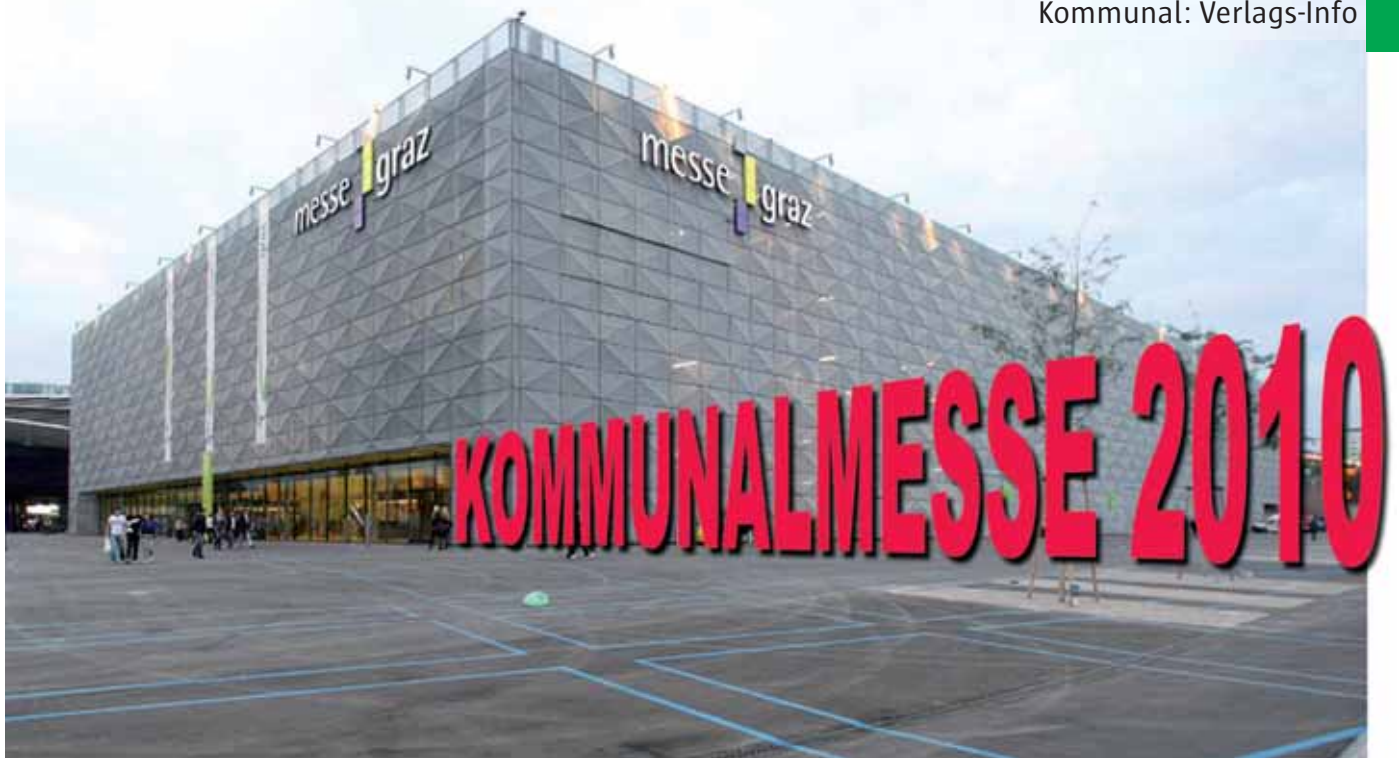
6600 Quadratmeter groß ist die Halle A im Obergeschoss der Grazer Messe: Hier wird die KOMMUNALMESSE 2010 stattfinden.

KOMMUNALMESSE 2010 und der 57. Österreichische Gemeindetag in Graz